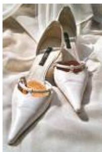
Sonderpreis: 99.00 EUR