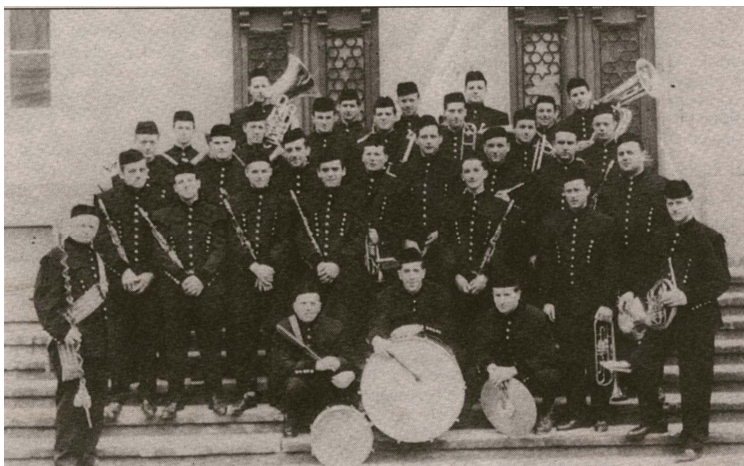
IDRIJSKA RUDARSKA GODBA NA PIHALA JE NAJSTAREJŠA V SLOVENIJI