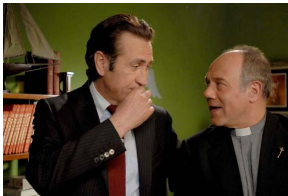
Marco Giallini (a sinistra) e Carlo Verdone (a destra)

Roma, una mattina di novembre. Ho un appuntamento con l'attore Marco Giallini. Lo raggiungo in taxi e lo trovo accerchiato dai fan: chi scatta selfie , chi chiede l'autografo. Marco, nato e cresciuto in una borgata della capitale, 'il Giallo ' per gli amici, famiglia operaia, ha fatto una lunga gavetta in ruoli di secondo piano. È stato lanciato nel 2008 dalla serie tv Romanzo criminale ma è esploso negli ultimi anni grazie alle commedie di Carlo Verdone. E continua a lavorare senza sosta.