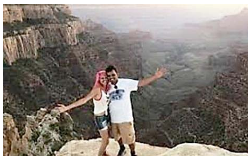
La coppia. Caduti in un burrone nel parco nazionale di Yosemite.

Una tragedia per una diffusa moda, che purtroppo - nonostante i tanti avvertimenti delle forze dell'ordine - continua a imperversare.